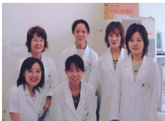
薬剤部のスタッフ

お薬について効きたいこと、分からないこと等がございましたら、ご遠慮なくお申し出ください。