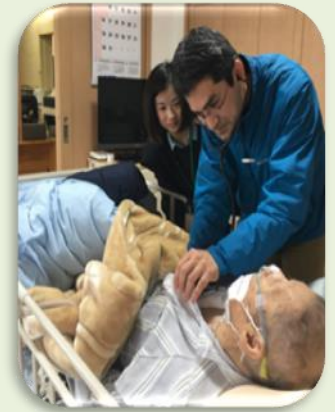
【ご自宅で点滴や採血もできます】