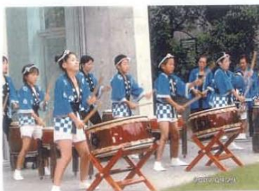
一津田祭り太鼓(津田小学校の皆さん)

2007年10月6日(土曜日)は「世界ホスピスデー」です。これにあわせて日本ホスピス緩和ケア協会は2007年9月30日～10月6日を「ホスピス緩和ケア週間」とし、全国のホスピス緩和ケア病棟では様々なイベントが開催されました。