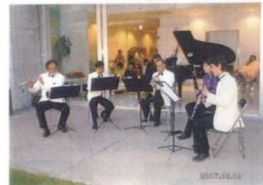
↓木管五重奏(アンサンブルダンツィの皆さん)